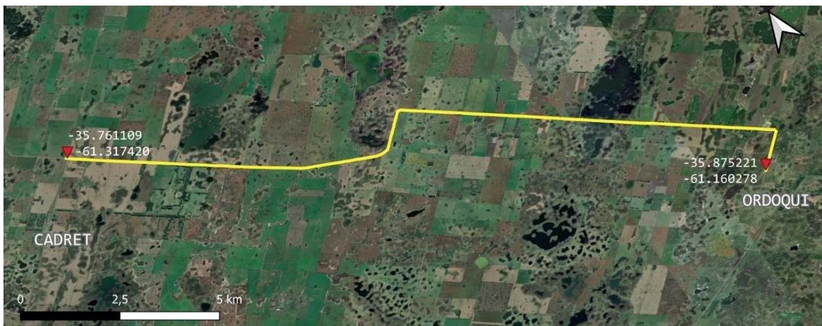
Imagen 1 - Croquis de ubicación del tramo "Ruta Provincial N° 50"

A continuación, puede visualizarse la ubicación del mismo: