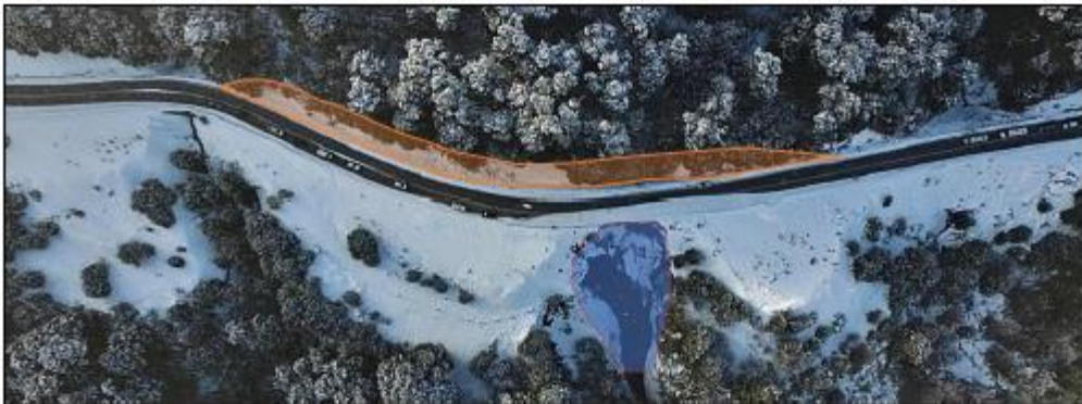
Fig. 1 Sector de derrumbe sombreado en azul de imagen 10/07/2023. Sombreado naranja se indica ubicación de desvío.

El presente SERVICIO tiene por objeto la provisión de los materiales y el alquiler de equipos viales que posibiliten la construcción de un desvío alternativo ubicado en el sector del contratalud (lado este), de tal forma de alejar el tránsito de la zona comprometida. El mismo deberá tener un ancho que permita la circulación vehicular en ambos sentidos.