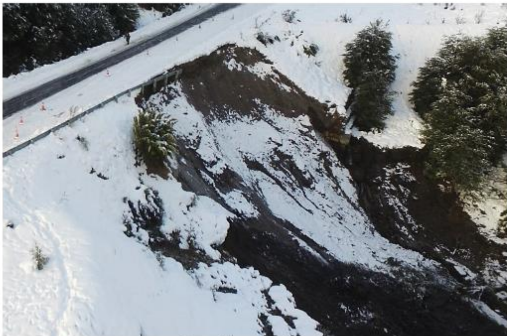
Vista hacia el Sur (10/07/2023).