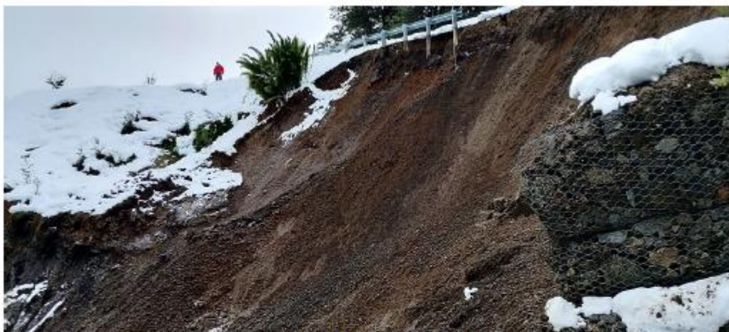
Vista hacia el Norte (07/07/2023).